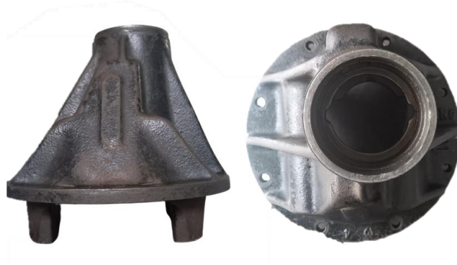
Gambar 1. 2 Differential Housing Kijang 5k

komponen-komponen differential yang lain selain itu differential case ini juga berfungsi untuk meneruskan tenaga putar dari ring gear menuju pinion gear . Dilihat dari bentuk differential housing yang memiliki kontur luar dan dalam yang rumit serta ukuran dari differential housing itu sendiri maka proses pembuatan differential housing menggunakan metode yang dibuat dengan pengecoran logam.