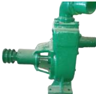
Gambar 1. 2 Pompa Air Tanikaya tipe DN 100

Seperti pada gambar 1.1 Casing merupakan bagian luar dari pompa yang berfungsi sebagai pelindung elemen di dalamnya. Impeller berfungsi untuk mengubah energi mekanis dari pompa menjadi energi kecepatan pada cairan/fluida yang dipompa secara kontinyu. Shaft atau Poros berfungsi untuk meneruskan momen puntir dari penggerak selama beroperasi dan tempat tumpuan impeller dan bagian-bagian lainnya yang berputar. Eye of impeller adalah bagian masuk pada arah hisap impeller. Bearing atau Bantalan berfungsi untuk menumpu atau menahan beban dari poros agar dapat berputar. Lubricating reservoir atau pelumas. Bearing juga berfungsi untuk memperlancar putaran poros dan menahan poros agar tetap pada tempatnya, sehingga kerugian gesek dapat diperkecil. Sedangkan bearing housing atau rumah bantalan adalah komponen struktural yang dirancang untuk mendukung bantalan. 1