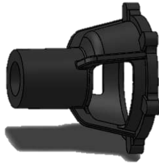
Gambar 1. 3 Adaptor Pompa Air Tanikaya tipe DN 100

Bearing housing adalah salah satu bagian yang memiliki fungsi sebagai rumah dari sebuah roda bearing yang berputar yang berfungsi untuk menopang poros agar tidak menimbulkan gesekan yang berlebihan saat berputar. Bearing harus cukup kuat agar poros dan komponen mesin yang lainnya dapat bekerja dengan baik. Bearing tersebut akan tersambung dengan poros besi panjang dan impeller, yang didalamnya di isi oleh oli atau pelumas agar roda bearing mampu bekerja dengan baik dan terhindar dari karat.