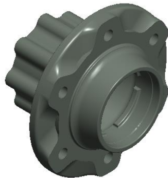
Gambar 1. 2 Hub Rear Wheel Fe 84

Dalam pembuatan komponen Hub rear wheel Fe 84 material yang digunakan memiliki pengaruh besar terhadap kualitas untuk memenuhi karakteristik material pada benda tersebut. Material besi cor bergrafit bulat atau Ferro Casting Ductile telah menjadi pilihan yang populer dalam industri otomotif untuk berbagai komponen Hub rear wheel Fe 84 . Hub rear wheel Fe 84 dituntut memiliki ketahanan aus dan kekuatan tinggi yang terdapat di dalamnya saat roda berputar, Selain itu Ferro Casting Ductile mempunyai karakter yang lebih ulet dan kekuatan tarik yang tinggi sehingga cocok untuk pembuatan Hub rear wheel Fe 84 yang harus mampu menahan beban berat kendaraan dan torsi yang dihasilkan oleh mesin.