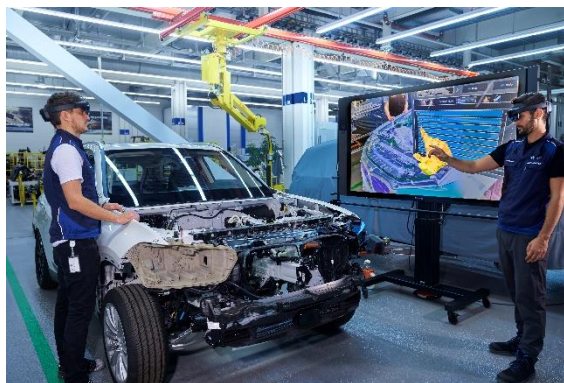
Gambar I. 1 Perakitan Mobil BMW Menggunakan Teknologi AR ( https://www.press.bmwgroup.com )

Revolusi industri keempat atau industri 4.0 merupakan industri yang menantang perubahan arus bisnis industri dari pasar penjual menjadi pasar pembeli. Hal ini menandakan bahwa produk dan proses harus sesuai dengan kebutuhan pelanggan yang didistribusikan dalam waktu singkat untuk memenuhi biaya yang sama seperti produksi massal [1]. Untuk mencapai hasil yang diharapkan, industri berinvestasi dalam teknologi baru yang dapat meningkatkan fleksibilitas manufaktur dan mengurangi prosedur pengambilan keputusan. Salah satu teknologi terdepan dalam konteks ini adalah Augmented Reality (AR), yang dapat diterapkan di berbagai bidang, seperti kedokteran, pendidikan, arsitektur, pemasaran, pemeliharaan dan proses perakitan [2]. Dalam operasi industri, AR ditampilkan sebagai alat yang kuat untuk meningkatkan fleksibilitas dan efisiensi proses.