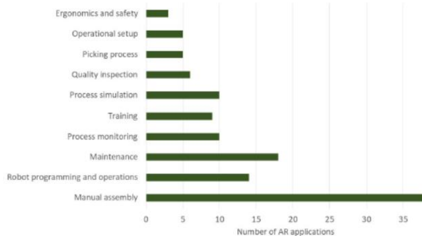
Gambar I. 3 Aplikasi Penggunaan Teknologi Augmented Reality [5]

Data pada jurnal berjudul “ A Survey of Industrial Augmented Reality ” yang diterbitkan pada tahun 2019 menunjukkan bahwa perakitan manual menempati posisi tertinggi dalam penerapan teknologi augmented reality . Aplikasi AR pada perakitan manual digunakan untuk memberikan instruksi kerja pada operator perakitan tentang cara menjalankan aktivitas perakitan.