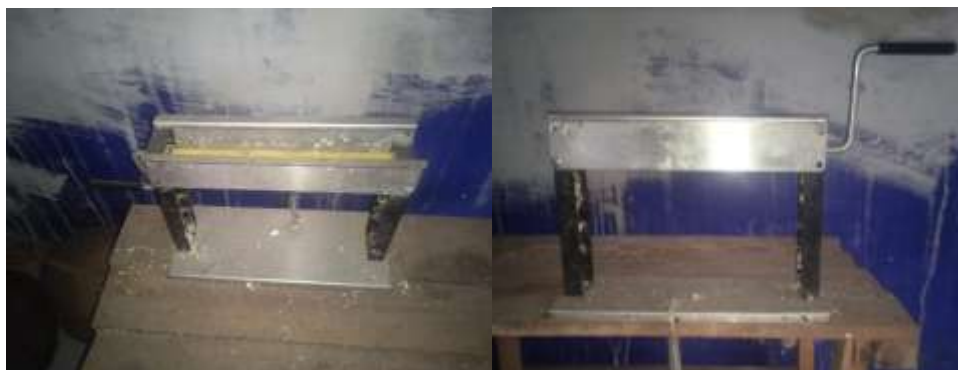
Gambar I.2 Alat Pengupas Telur Sederhana (Manual)

Selain kerusakan pada telur proses pengupasan manual dengan tangan dan alat manual ini juga akan memakan banyak waktu untuk menyelesaikan pesanan telur dalam jumlah banyak, seperti pesanan yang diterima yaitu 8.000 butir. Hal ini juga dapat menambah biaya operasional karena peternak harus membayar pekerja tambahan untuk mengupas telur. Akibatnya keuntungan yang didapat oleh peternak menjadi berkurang. Sehingga peternak terpaksa untuk menaikkan harga dari telur yang sudah matang menjadi lebih mahal, dengan tujuan untuk menutupi biaya operasional pengupasan. Namun hal ini dapat mengakibatkan minat dari para konsumen telur yang sudah matang dan terkupas menjadi menurun. Karena konsumen yang datang kepada peternak untuk memesan telur puyuh rebus yang sudah terkupas, yaitu sama dari UMKM atau dari perorangan, biasa konsumen memesan untuk kegiatan seperti catering untuk rumahan, untuk makan siang atau makan malam anak sekolah.