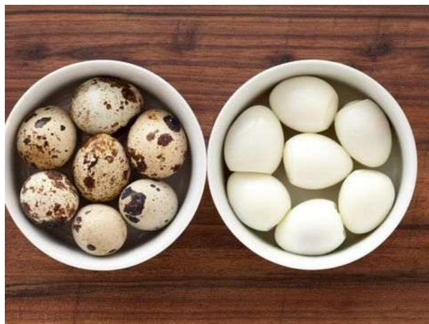
Gambar I.1 Telur puyuh mentah dan telur puyuh matang sudah terkupas[4]

Peternak burung puyuh selain menjual bibit burung puyuh dan telur puyuh mentah, ada juga peternak yang siap menjualkan telur puyuh yang sudah matang dan terkupas seperti pada Gambar I.1. Dan biasanya kebutuhan telur puyuh matang sering dipesan oleh para pengusaha yang bergerak di bidang catering. Telur puyuh matang ini juga sering kali mendapatkan pesanan hingga ribuan. Namun Ketika pesanan yang banyak sering kali menjadi kendala terutama pada proses pengupasan telur yang harus dilakukan secara manual. Kendala yang terjadi akibat proses pengupasan secara manual ini yaitu memerlukan waktu yang lama, karena dalam 1 jam peternak hanya mampu mengupas telur 300 butir oleh satu pekerja, dan satu pekerja dibayar Rp 50.000,00 untuk menyelesaikan pesanan. Selain itu, pengupasan dengan tangan juga dapat mengakibatkan kerusakan pada telur, sehingga perlu diganti telur-telur yang rusak tersebut. Sehingga mengakibatkan kebutuhan telur yang dipesan tidak tercapai, dan memakan waktu yang banyak terutama pada proses pengupasan. Walaupun sudah ada sebagian dari UMKM yang sudah menggunakan alat bantu sederhana untuk mengupas telur. Namun tetap saja alat sederhana tersebut masih belum bisa mencukupi kebutuhan dari pesanan telur yang sangat banyak.