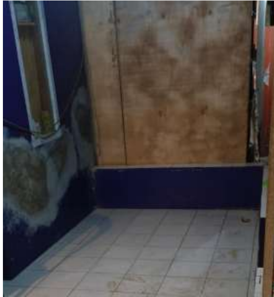
Gambar I.3 Tempat yang tersedia di peternak